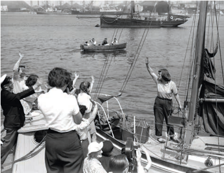
Ann Davison verlässt mit der Felicity Ann den Hafen von Plymouth, 1952

mit dem Rettungsfloß getrieben war, dieses Mal jedoch allein, auf einem eigenen Boot und mit dem festen Vorsatz, auf direktem Wege zur Insel Madeira zu segeln, eine Fahrt von etwa 1200 Seemeilen. (In Seemeilen werde ich alle Entfernungen auf See angeben, wobei eine Seemeile 1,852 Kilometer entspricht.)